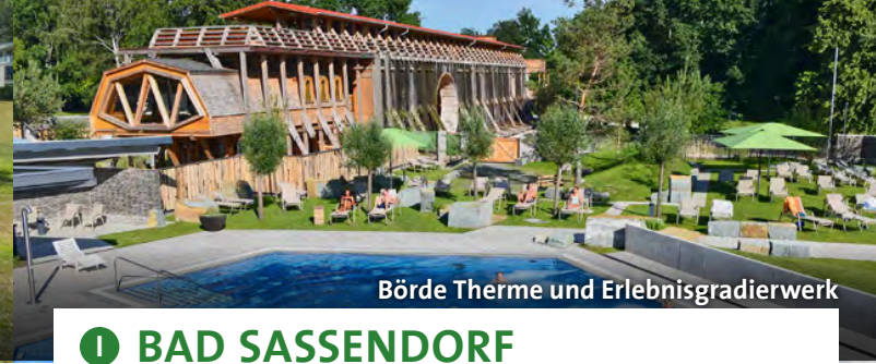
Börde Therme und Erlebnisgradierwerk

Ob unter den Schatten spendenden Bäumen des Kurparks, bei einer Massage in der Walibo Therme oder auf einer Radtour an Höfen, Wiesen und Wäldern entlang – Bad Waldliesborn lockt mit Entspannung. An heißen Tagen erfrischt Sie ein Spaziergang auf dem Nebelweg im Kurpark. Für Abwechslung sorgen Ausflüge in Lippstadts historische Altstadt oder zu den Lippeauen, die regionale Gastronomie und das vielseitige Veranstaltungsprogramm der Stadt. www.lippstadt-badwaldliesborn.de