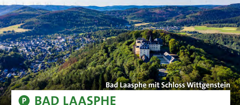
Bad Laasphe mit Schloss Wittgenstein