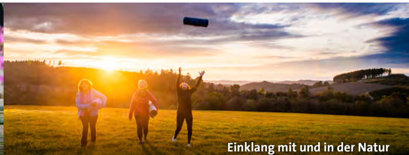
Einklang mit und in der Natur