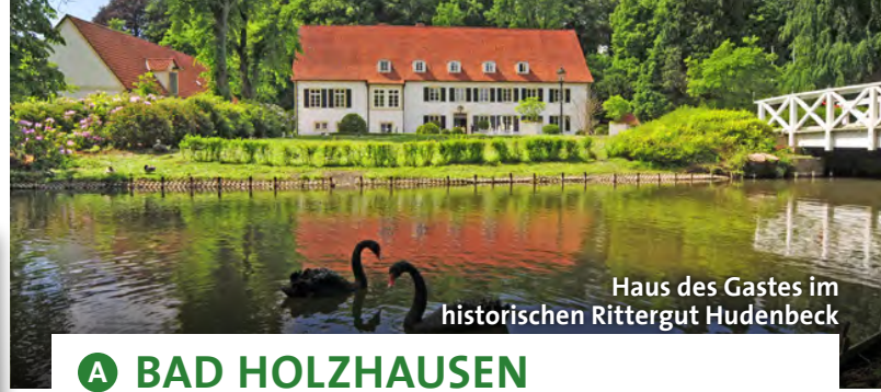
Haus des Gastes im historischen Rittergut Hudenberg