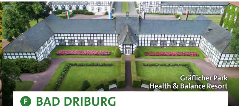
Gräflicher Park Health & Balance Resort