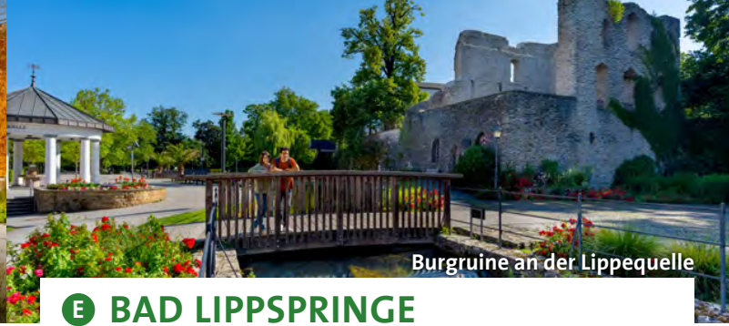
Burgruine an der Lippequelle