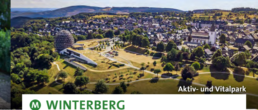
Aktiv- und Vitalpark